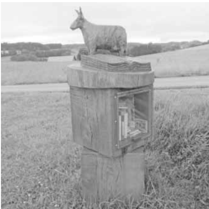
Die Lesebank zwischen Weeg und Hub.