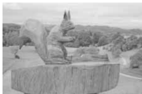
Das Eichhörnchen bei Grub