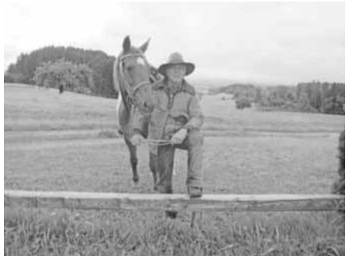
Der „Bilderrahmen“ bei Hub