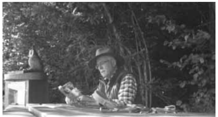
An der Lesebank zwischen Lempen und Herben.