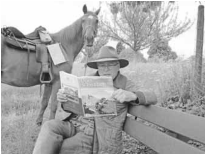
Die Lesebank bei Schönberg