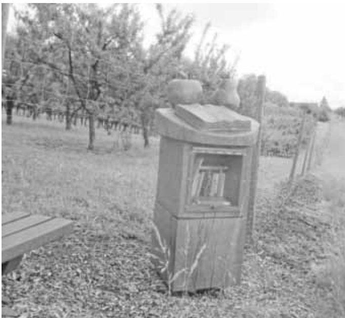
Die Bibliothek bei Schönberg