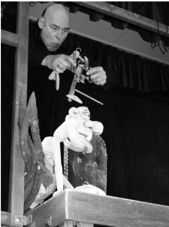
Der menschenfressende Oger freute sich schon darauf, Jack zu verspeisen