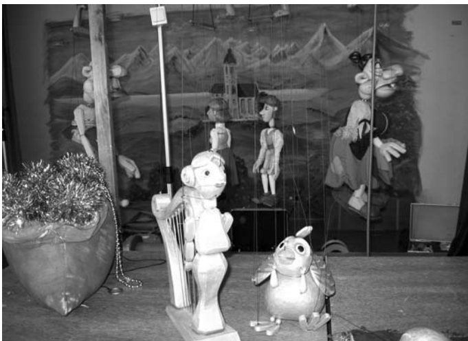
Am Ende gab es einen Sack voll Gold für die armen Leute.