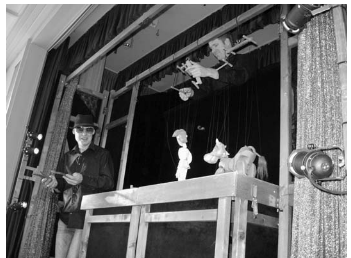
Jack verkauft die einzige Kuh seiner Mutter für fünf magische Bohnen