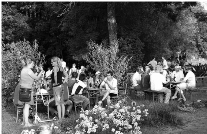
Open Air im Sinnesgarten der St. Gallus-Hilfe Rosenharz mit dem Duo „Music Affair“.