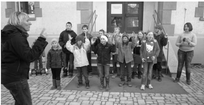
Auch die Schülerinnen und Schüler der Lindenschule waren voll der Freude und brachten diese mit einer extra einstudierten Vorführung zum Ausdruck.