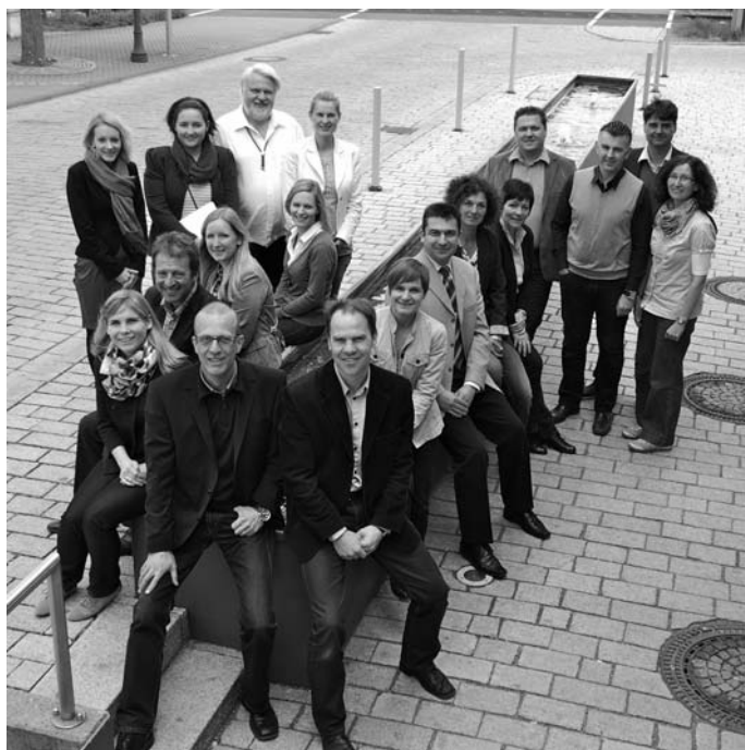
„Hier entstehen Synergien“: Oberschwäbische Leistungsträger aus dem Bereich Gesundheitstourismus haben sich zu einem Kompetenz-Netzwerk zusammengeschlossen.