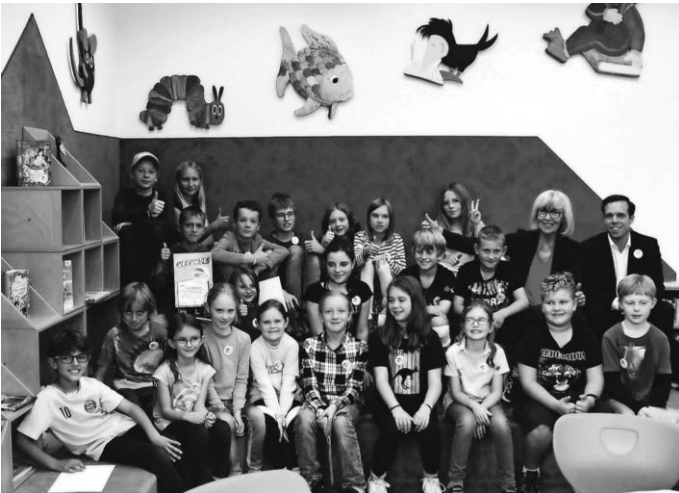
Herzlichen Glückwunsch an die Siegergruppe