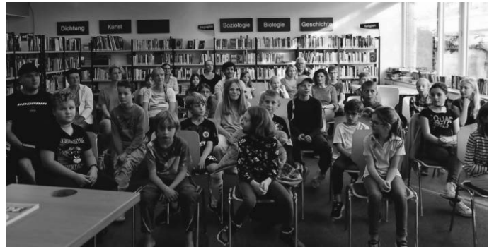
Einige Teilnehmerinnen und Teilnehmer fehlen.