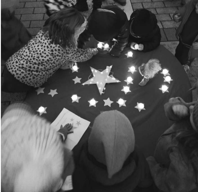
Die Kinder schmücken den Sternenhimmel.

denn bei diesem „Türchen“ des Adventskalenders wurden eine Mitmachgeschichte erzählt und gemeinsam Adventslieder gesungen. Begonnen wurde mit dem Lied „Wieder kommen wir zusammen“, während dem nach und nach die Kerzen am Adventskranz angingen. Im Anschluss begann die Erzählung einer Weihnachtsgeschichte und es kamen ein Stern und ein Mädchen aus einem Säckchen um die Geschichte zu untermalen.