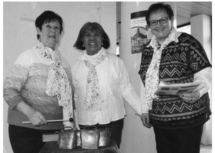
Zu zweit oder zu dritt wollen sie den „Staub von der Seele waschen“ ...