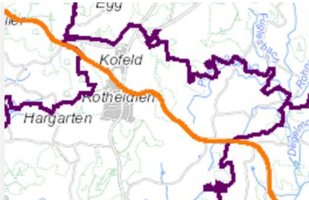
Abbildung 1: Lärmkartierung Bodnegg, LUBW 2017 (Stufe 3)

Der Kartierung der LUBW 3. Stufe liegen im Fall der Gemeinde Bodnegg die Verkehrszahlen aus dem Verkehrsmonitoring 2015 zu Grunde.