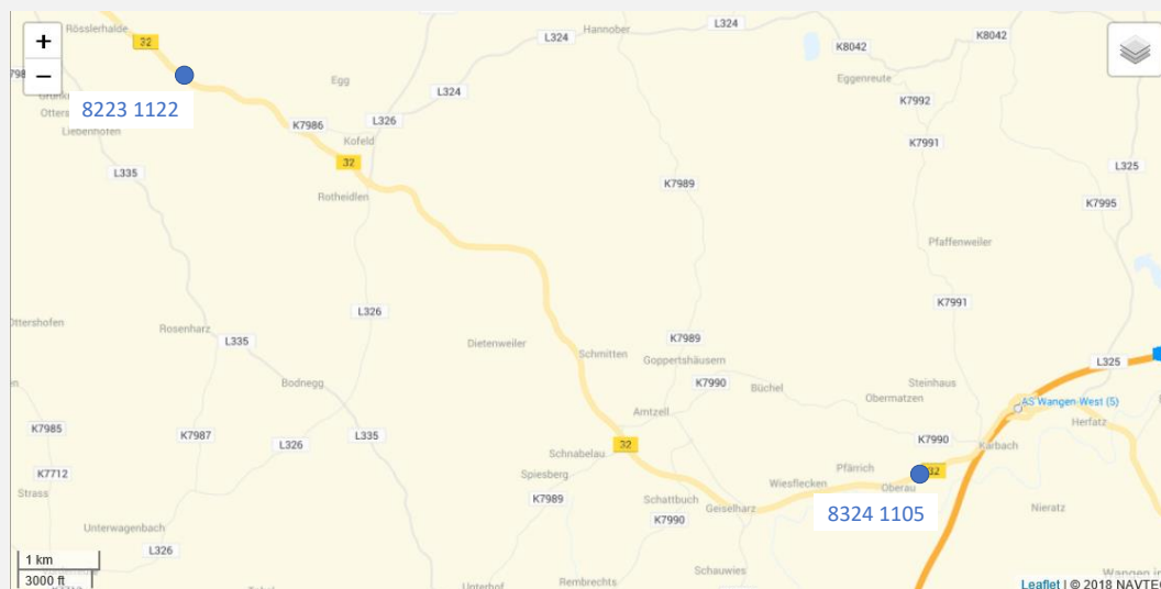
Abbildung 2: Zählstellenplan SVZ Baden-Württemberg, Ausschnitt

Der Schienenlärm ist nicht Gegenstand dieses Lärmaktionsplans. Die Gemeinde Bodnegg ist nicht vom Schienenverkehrslärm betroffen, da keine Schienenwege über das Gemarkungsgebiet verlaufen.